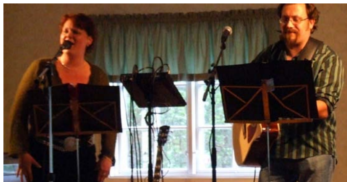
Duo Dito in action